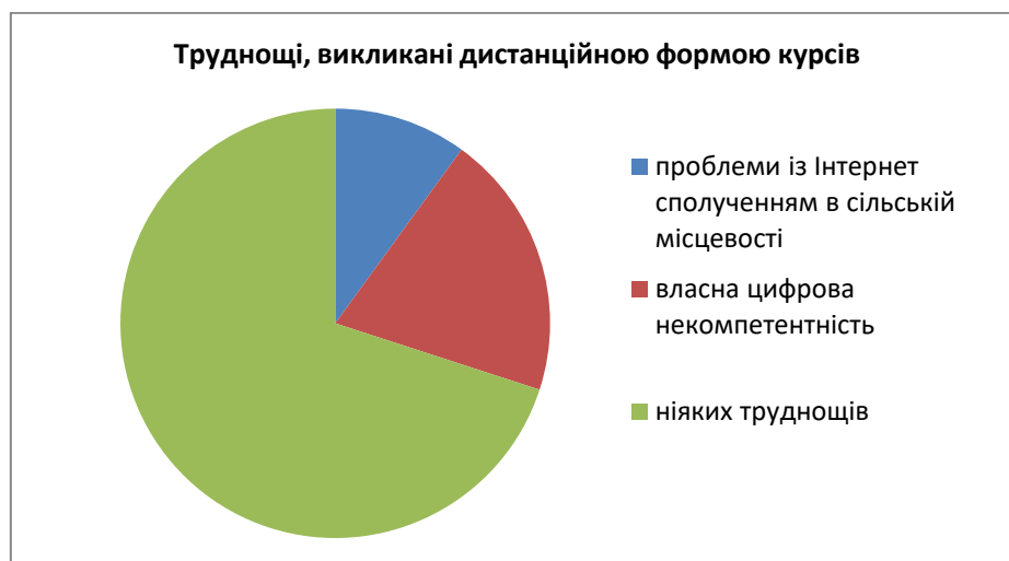
Рис. 2. Результат оцінювання труднощів дистанційної форми курсів підвищення кваліфікації Уманського державного педагогічного університету імені Павла Тичини

Проте, незважаючи на вищезначені труднощі дистанційної форми курсів, 50 % респондентів віддають перевагу саме їй, зазначаючи, що це єдина прийнятна форма, яка дозволить реалізувати програму курсів підвищення кваліфікації без відриву від основного місця роботи. Для зручності навчання на курсах підвищення кваліфікації відбувалося у вечірній час, що вможливило успішне відвідування курсів. Проте, оцінюючи форму навчання, 35 % слухачів курсів зазначили, що віддали б перевагу очній формі, і 15 % – комбінованій (див. рис. 3). Слухачі очних курсів зазначають, що спілкування з колегами під час занять дозволяє не лише поділитися досвідом, а й поспілкуватися англійською мовою наживо, здобути певну іншомовну мовленнєву компетентність, що є надзвичайно важливим для тих учителів, які працюють у малокомплектних закладах загальної середньої освіти.