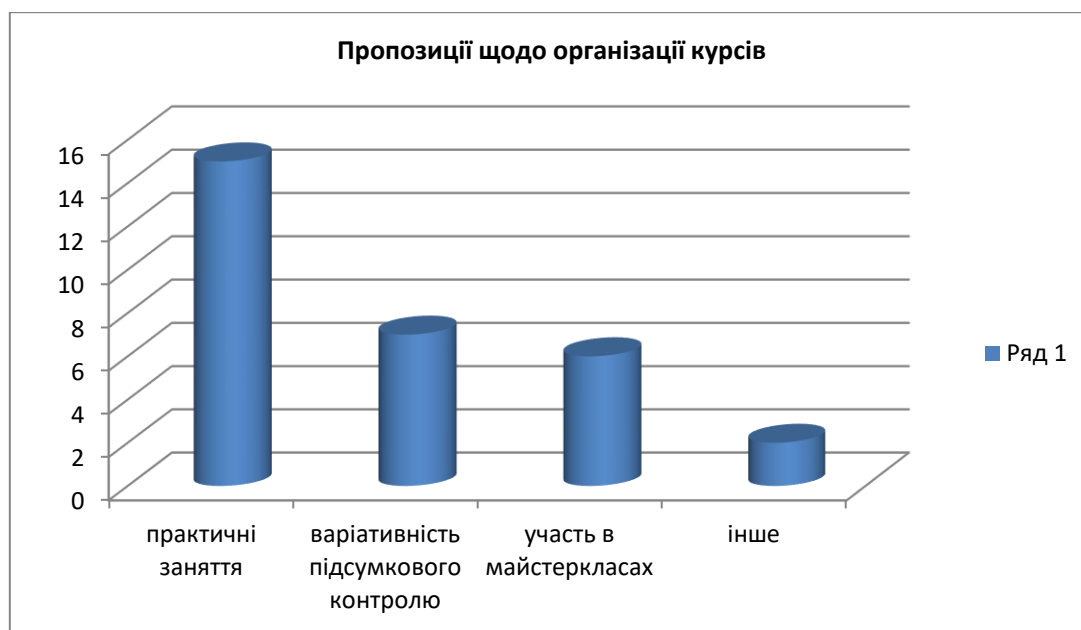
Рис. 4. Результат оцінювання пропозицій щодо організації курсів підвищення кваліфікації

Вивчаючи питання організації курсів, варто звернути увагу на вивчення умов роботи учителів, аби зуміти забезпечити продуктивну роботу курсів підвищення кваліфікації в освітянському просторі. Тож учителями було окреслено певні пропозиції щодо організації роботи курсів, а саме: збільшення годин на практичну підготовку (50 %); варіативність завдань для підсумкового контролю (23 %); можливість участі у воркшопах та майстер-класах викладачів-методистів Уманського державного педагогічного університету імені Павла Тичини (20 %), інше (7 %) (див. рис. 4).