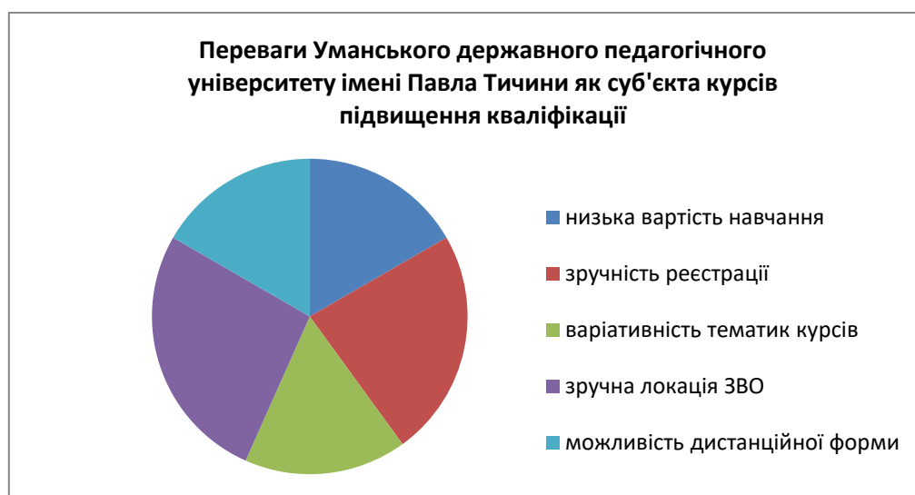
Рис. 1. Результат оцінювання переваг Уманського державного педагогічного університету як суб'єкта курсів підвищення кваліфікації.

Щодо обрання Уманського державного педагогічного університету імені Павла Тичини серед суб'єктів підвищення кваліфікації було відзначено кілька переваг ЗВО, як-то: зручне розташування ЗВО (27 %), онлайн-реєстрація (23 %), низька вартість (17 %), варіативність тематики курсів (17 %) та дистанційна форма курсів (17 %) (див. рис. 1).