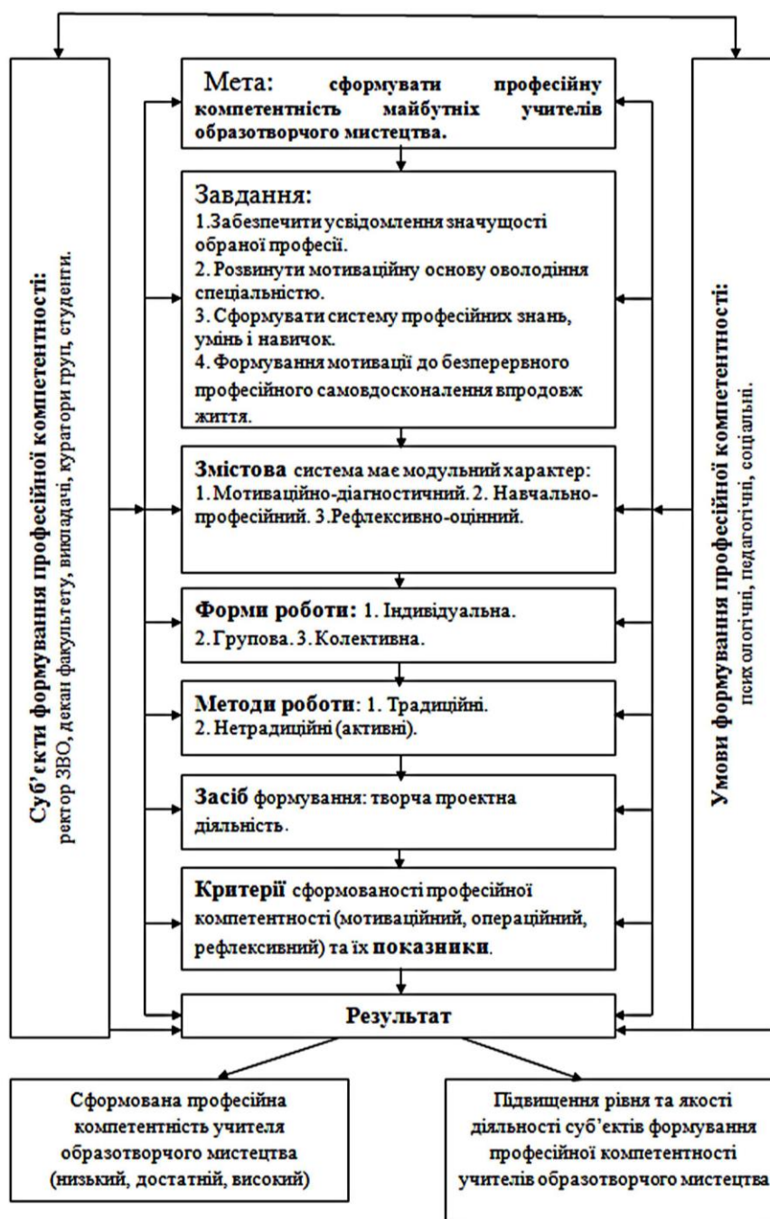
Рис. 1. Модель формування професійної компетентності майбутніх учителів образотворчого мистецтва засобами творчої проектної діяльності

З метою успішного та повного формування професійної компетентності майбутніх учителів образотворчого мистецтва ми орієнтувалися на внутрішню мотивацію особистості, лишаючи певне місце (мінімальний відсоток) на зовнішні фактори, які, крім внутрішньої та зовнішньої, розділили на три рівні, що відображено у розробленій нами схемі (рис. 2).