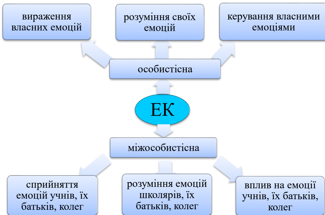
Рис. 1. Зміст емоційної компетентності майбутнього вчителя початкової школи

Особистісний компонент. Вираження власних емоцій: здатність адекватно виявляти і виражати власний емоційний стан за допомогою міміки обличчя, жестів, інтонаційної виразності мовлення, сили і висоти голосу. Оволодіння майбутнім учителем початкової школи широким спектром вербальних (логічний наголос, смислова пауза, емоційне забарвлення голосу, виразність, чіткість мовлення) і невербальних інструментів (жести, міміка, пантоміміка, погляд) допоможе яскраво виражати свої емоції, почуття, що буде сприяти емоційному викладу навчального матеріалу, кращому розумінню учнями.