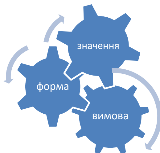
Рис. 3 Структура типу уроку MFP

Структура MFP типу уроку іноземної мови складається теж з трьох етапів. Meaning – етап пояснення значення слова, виразу чи граматичної структури шляхом використання їх у контексті. Form передає усі можливі трансформації та можливості для вживання мовної одиниці її зв'язок з іншими лексемами, колокація. Pronunciation передбачає фокусування на фонології, звуках, інтонації, наголосі, тощо (див. рис. 3).