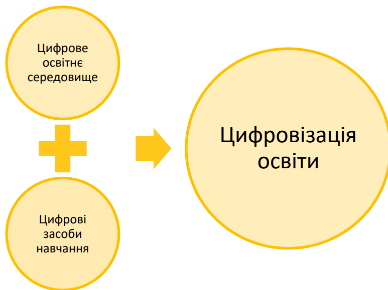
Рис. 2. Структурні складові цифровізації освіти (створено автором)

Варто зауважити, що цифровізація освіти передбачає створення об'єктивних умов для розвитку інформаційного суспільства, що сприяє урізноманітненню напрямів її розвитку (рис. 3) [1, с. 24].